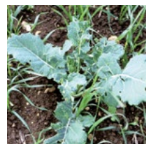
Ausfallraps inkl. Clearfield®1-toleranter Sorten