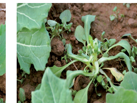
Ackerhellerkraut – 7 Tage nach Behandlung