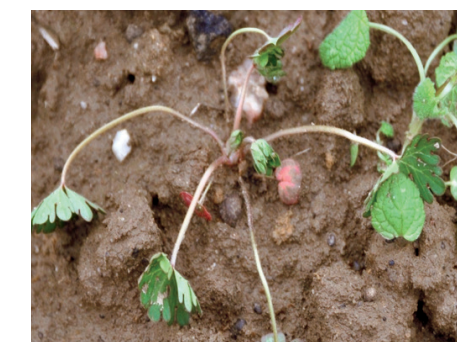
Kleiner Storchschnabel – 1 Tag nach Behandlung

Belkar ist schnell wirksam. Der Effekt auf die Unkräuter zeigt sich innerhalb kürzester Zeit. So können je nach Unkraut erste Symptome bereits einen Tag nach Anwendung beobachtet werden.