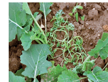
Erdrauch – 2 Tage nach Behandlung